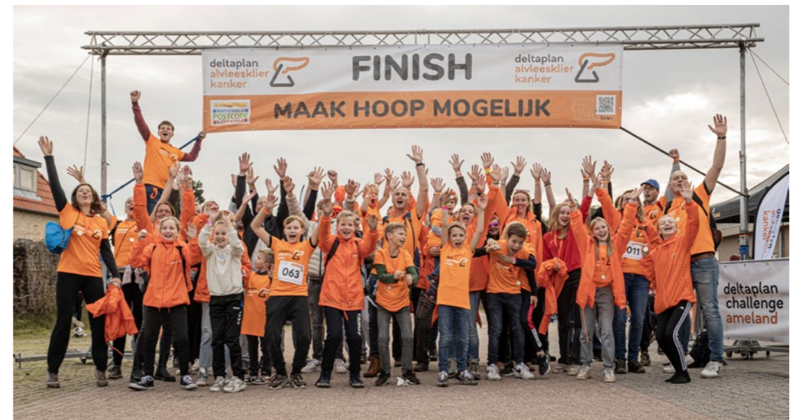
Deltaplan Challenge Ameland 2022.

Het Deltaplan is afhankelijk van donaties. Daarom werkten we ook dit jaar aan het vergroten van onze naamsbekendheid en het werven van fondsen. De band Van Dik Hout verbond zich als ambassadeur. Met een pop-up concert op De Dam zetten ze het Deltaplan in de spotlight. We organiseerden een succesvolle tweede editie van de Deltaplan Challenge Ameland, waarbij meer dan 100 deelnemers (veelal nabestaanden) geld inzamelden voor meer onderzoek. Ook organiseerden we een succesvolle eerste editie van Deltaplan Challenge De Vecht, waarbij patiënten en arts-onderzoekers samen in actie kwamen. Daarnaast vragen steeds meer nabestaanden om een donatie voor het Deltaplan tijdens de uitvaart. Het aantal volgers op onze sociale media, abonnees op de maandelijkse nieuwsbrief en bezoekers van de website groeiden gestaag.