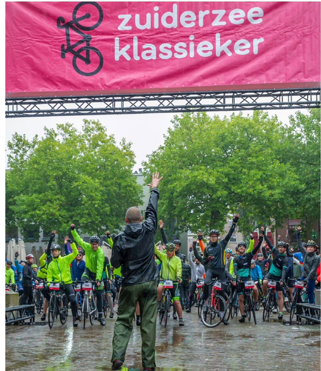
Aftrap Zuiderzee Klassieker 24 september 2022.

In september organiseerden we de jaarlijkse Zuiderzee Klassieker. Het wielerevenement, dat door oud-schaatser Jochem Uytdehaage werd afgetrapt, startte vanuit het centrum van Amersfoort, de vestigingsplaats van MLDS. Bijna 400 deelnemers lieten zich sponsoren en trotseerden de regen om geld op te halen voor MLDS. Naast dit evenement, haalden patiënten en hun naasten ook via acties die ze zelf door het jaar heen op touw zetten, prachtige bedragen op voor MLDS.