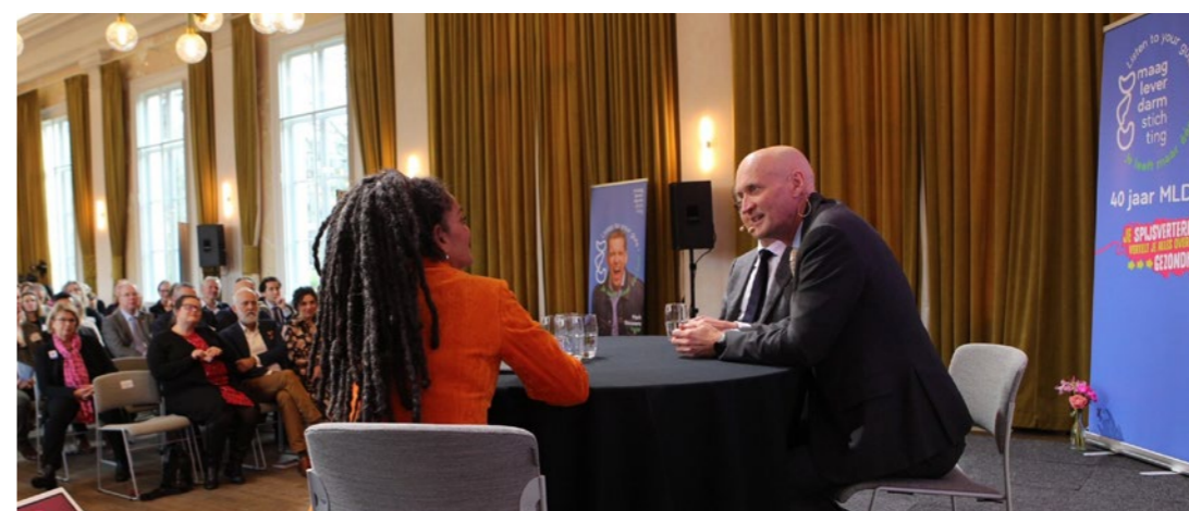
Minister Kuipers: "Oplossing voor meer gezondheid begint in de buik."

Tijdens de bijeenkomst in ARTIS werd ook bekend gemaakt welke onderzoeksteams dit jaar subsidie ontvangen voor vroege opsporing van spijsverteringsziekten. We geloven namelijk dat 'er op tijd bij zijn' voor veel spijsverteringsziekten het verschil kan maken. In de kans op genezing, maar ook als het gaat om kwaliteit van leven. Daarom zetten we onze subsidies mede in om aandoeningen eerder op te sporen. De subsidies zijn een belangrijk onderdeel van het werk van de MLDS. En dat zal het de komende jaren ook blijven. Zolang dat nodig is.