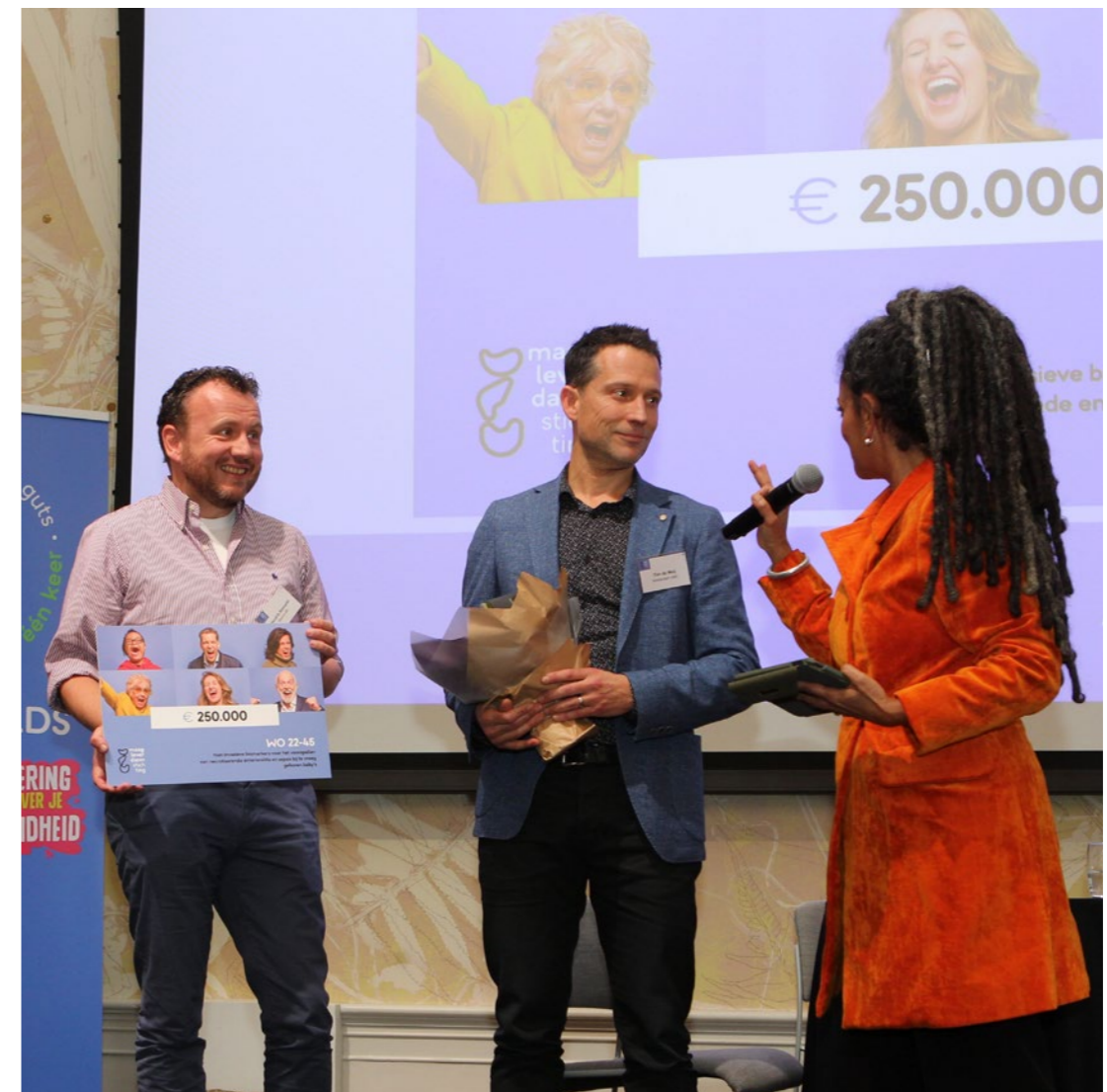
Bekendmaking subsidietoekenningen Right on Time op 7 december 2022.

ervaringsdeskundigenpanel en internationale referenten kende MLDS in totaal € 1 miljoen subsidie toe aan onderzoeksprojecten in relatie tot darmontstekingen, erfelijke darmkanker, NET-tumoren en chronische leverschade.